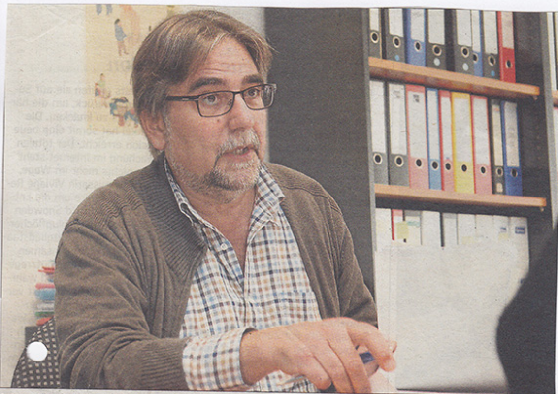
Aujourd'hui, les gens restent plus longtemps dans la rue, observe René Kneip.