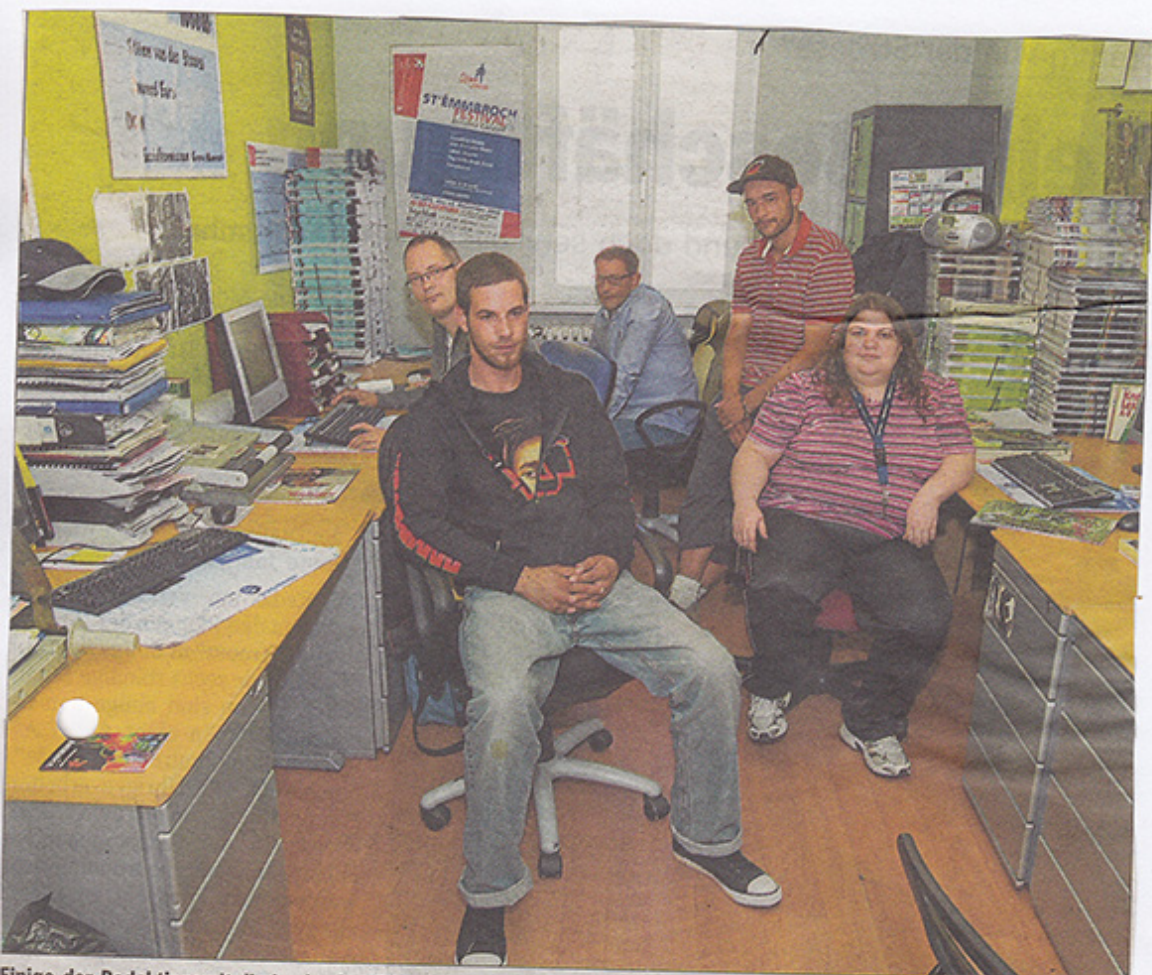
Einige der Redaktionsmitglieder in den Räumen der „Stëmm vun der Strooss“.