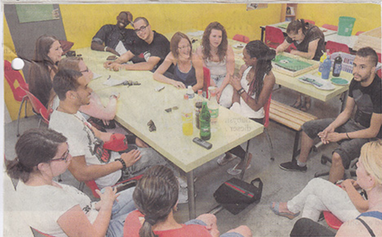
Die jungen Filmliebhaber tauschen sich über die Erlebnisse aus