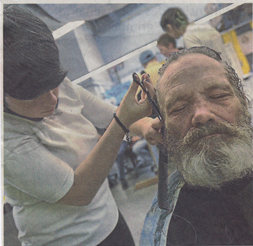
Hier, 104 personnes démunies ont été coiffées gratuitement dans les locaux de la Stämm vun der Strooss.