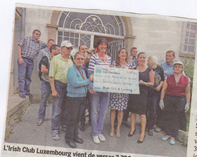
L'Irish Club Luxembourg vient de verser 3 700 euros à la Stëmm.