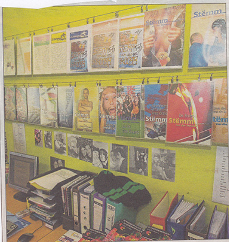
Alle zwei Monate erscheint eine neue Ausgabe des Magazins.