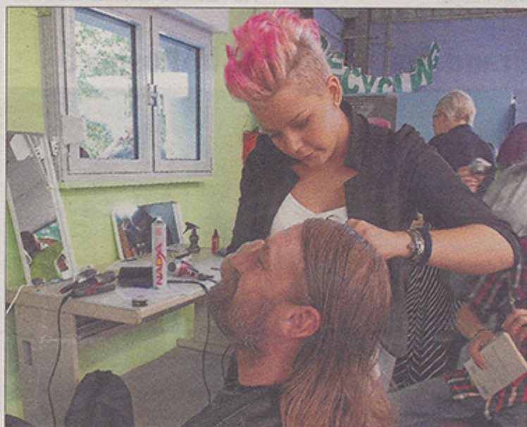
Den ganzen Tag waren die Frisöre im Einsatz.

Shuttle-Busse sind den ganzen Tag über gefahren und haben die Interessierten beim Centre Ulys-