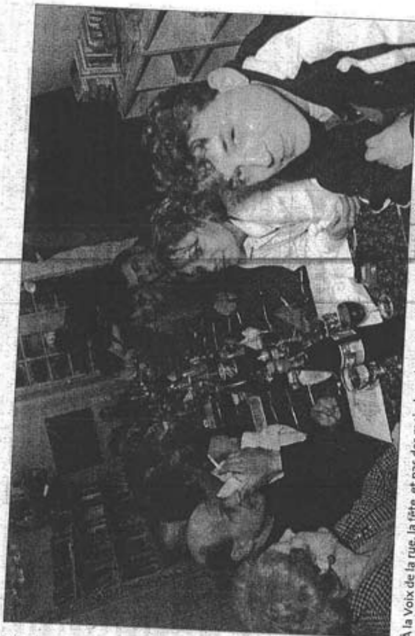
À la Voix de la rue, la fête, et pas des moindres, était de mise. Soixante-dix personnes sont attablées, les scouts de Mamer étaient aux fourneaux et des sympathisants de l'ASBL sont venus en visiteurs.

Tout en nuance, il précise qu'«ici c'est peut-être une réponse, mais ce n'est pas la seule». Il faudrait créer des structures parallèles. Il apprend qu'«une agence va voir le jour en 2002 à Esch-sur-Alzette. La commune mettra à disposition un immeuble et un budget». Pas éton-