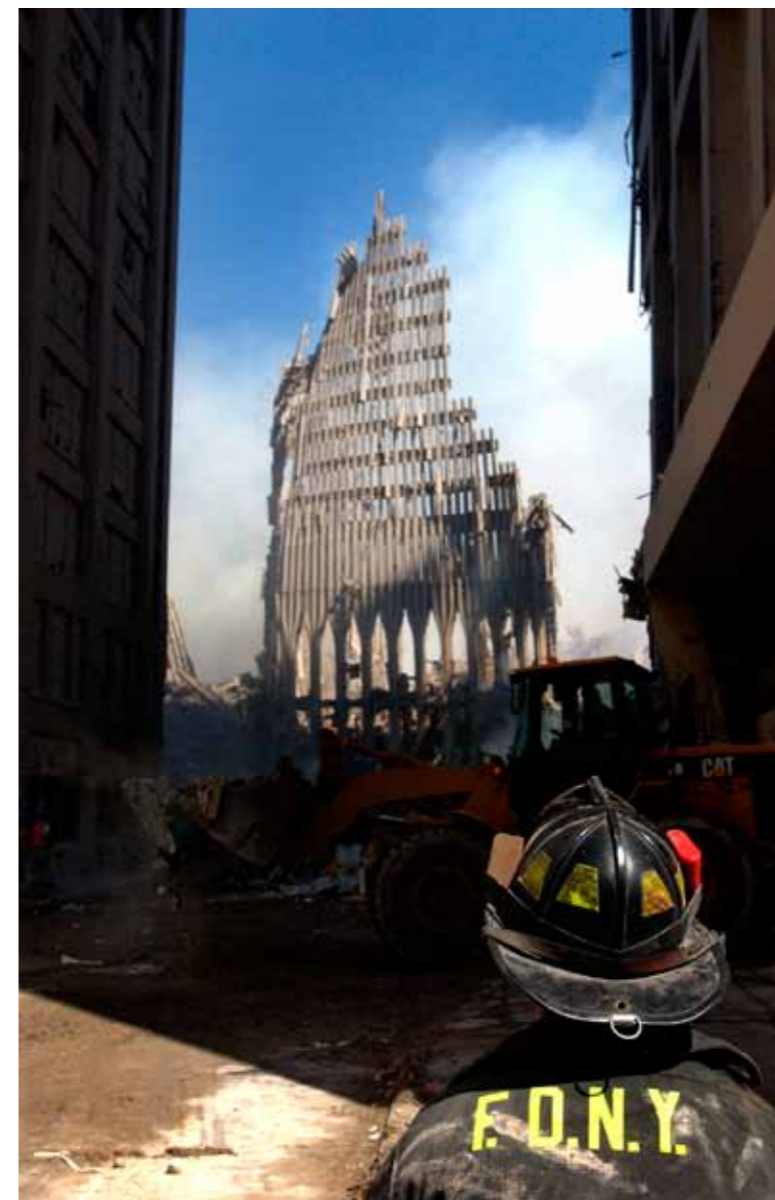
A New York City firefighter looks up at what remains of the World Trade Center after its collapse during the Sept. 11 terrorist attack.