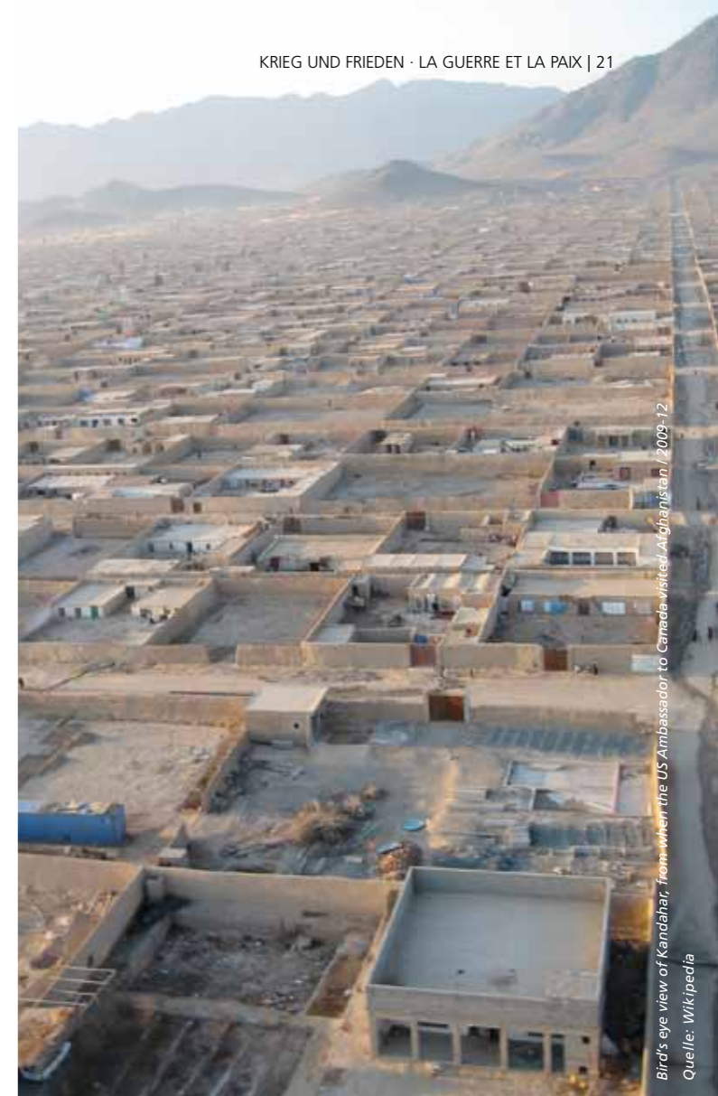
Bird's eye view of Kandahar, from when the US Ambassador to Canada visited Afghanistan / 2009-12