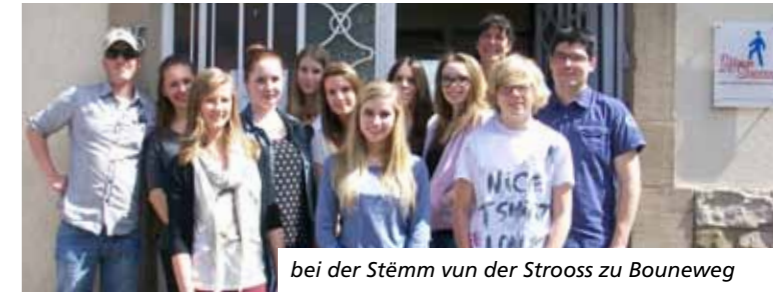
bei der Stëmm vun der Strooss zu Bouneweg

Fir méi gewuer ze gin, kuckt op: www.obdachlosegkeet.weebly.com