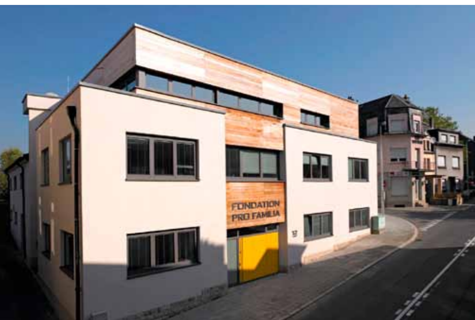
Centre de Consultation et de Médiation Familiale

D'Gemeng Diddeleng stellt der Fondatioun Pro Familia och eng Wunneng zur Verfügung, wou eng Fra mat hire Kanner kann opgeholl gi fir eng Iwwergangszäit, wat mir natierlech ganz staark begréissen. An där Hिसicht kann ee scho vun enger wäertvoller an aktiver Zesummenaarbecht schwätzen.