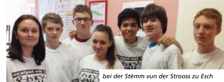
bei der Stëmm vun der Strooss zu Esch