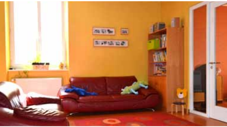
Salle de séjour de Centre Polyvalent pour Enfants