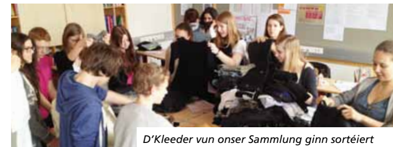
D'Kleeder vun onser Sammlung ginn sortéiert