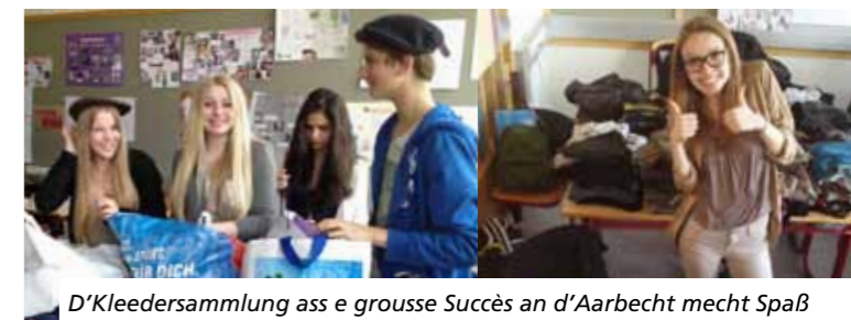
D'Kleedersammlung ass e grouse Succès an d'Aarbecht mecht Spaß