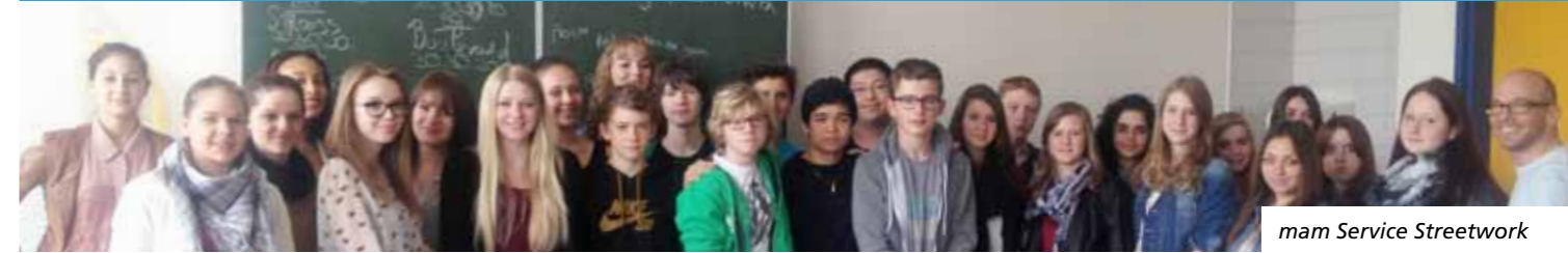
mam Service Streetwork

Mir, d'5e C12 aus dem Lycée Aline Mayrisch, waren op Besuch bei der Stëmm vun der Strooss zu Bounewegg an zu Esch, an och bei der Vollekskichen zu Bouneweg. Mir sinn dohi gaangen fir e Projet iwwer Obdachlosegkeet. Mir wollten erausfannen wéi deenen obdachlosen Leit hiren Alldag ass a waat d'Haaptgrënn vun der Obdachlosegkeet sinn.