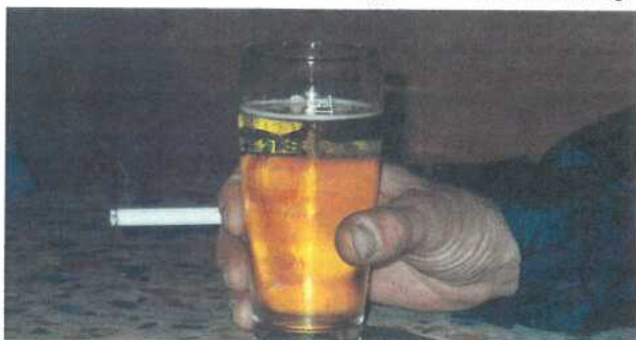
Eng peschen an ee gepescht kréien wéinst dem Béier, mee wéi ass et dann mam Graas?

Mir müssen net ëmmer alles eisen Nöperen noomaachen! Waat vir ee Gesetzprojet läit vir, am Fall wou een éng gedämmt huet a mam Auto uge-