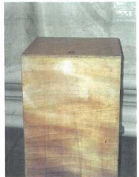
Mir bréngen lech un d'Ruder mee Dir rudert nët.