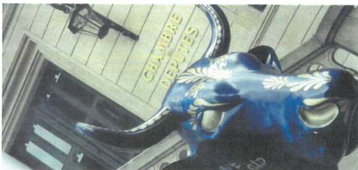
Eine Kuh sagt mehr als tausend Worte. Muh!