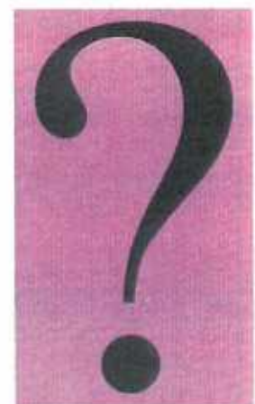
Wer blickt da noch durch?