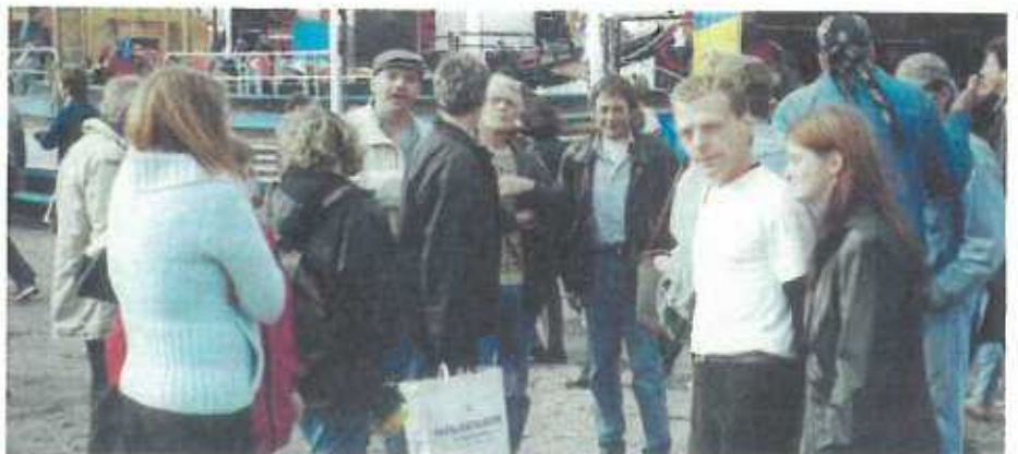
Eng kleng Paus, an dann geet et nees ronderemm.