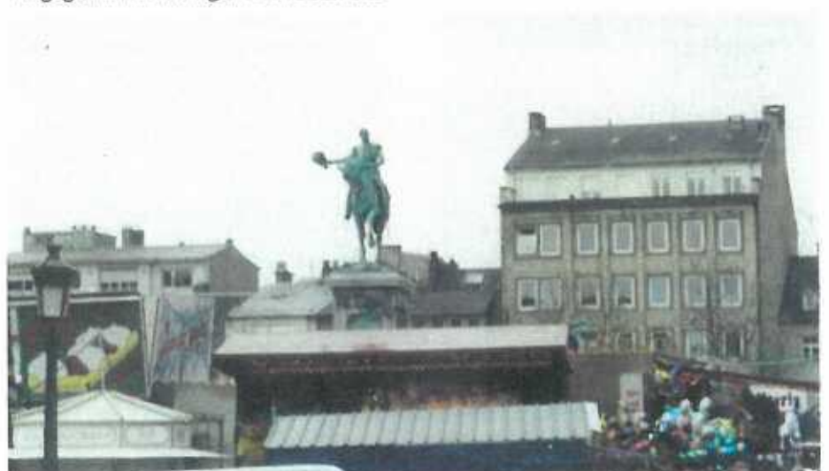
Politik. ein Jahrmarkt der Eitelkeit. Wie eh und je schweben die Herrschenden über den Problemen der Normalverbraucher.