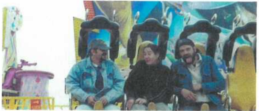
De John, d'Caroline um Top Spin.