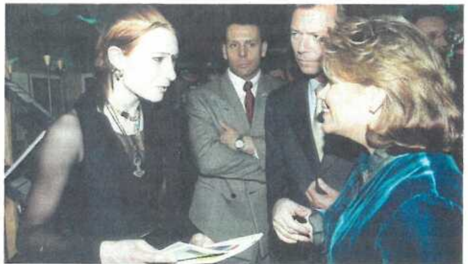
Rencontre fructueuse à la Foire des Migrations entre anarchie et monarchie: le dialogue semble possible.

Je serais contente si je pouvais déjà avoir vingt-cinq ans. Comme ça, j'aurais droit au R.M.G et je pourrais prendre