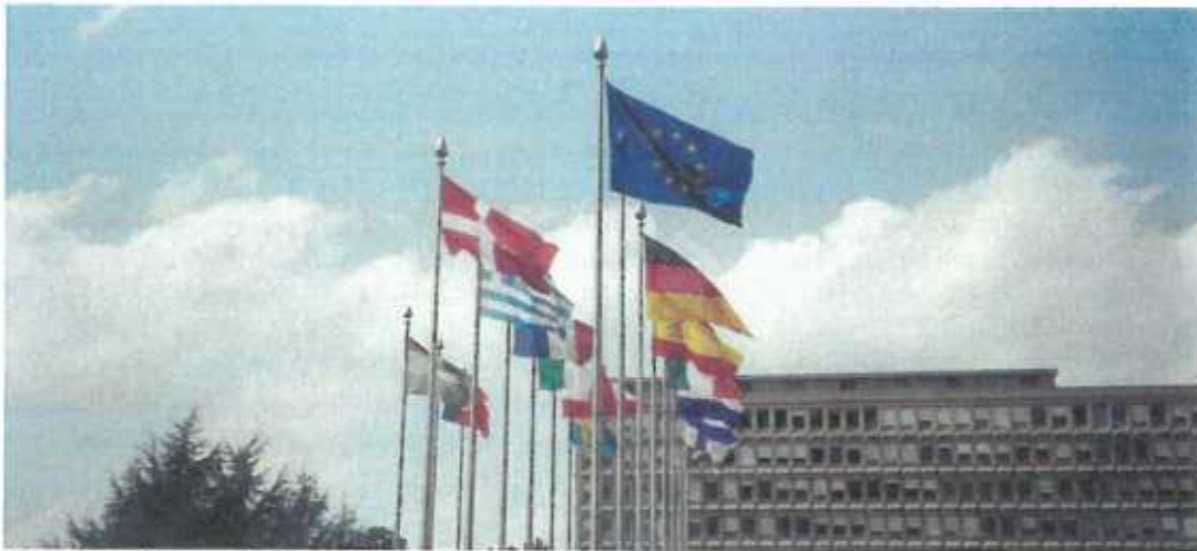
Vereinigtes Europa. Ist das wirklich die ideale Lösung?

Politik findet für die meisten Bürger außerhalb ihrer Reichweite statt. In Luxemburg sind Plebiszite eher die Ausnahme. Wie aber wird es aussehen, wenn eines nicht so fernen Tages unsere Tagespolitik nicht mehr von der Chambre des Députés, sondern von Brüssel aus gesteuert wird?