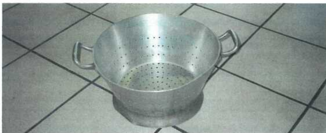
Erst versprechen, dann ein Gehirn haben wie ein Abtropfsieb.

Wie ist es möglich, dass in einem Land wie Luxemburg noch so viele Leute obdachlos sind? Denn wenn man unseren Politikern zuhört, gibt es ja keine Obdachlosen, weil ja jeder Hilfe bekommt. Man muss sich nur bemühen. Aber weit gefehlt, denn Augen öffnen meine Herren, die Realität sieht anders aus.