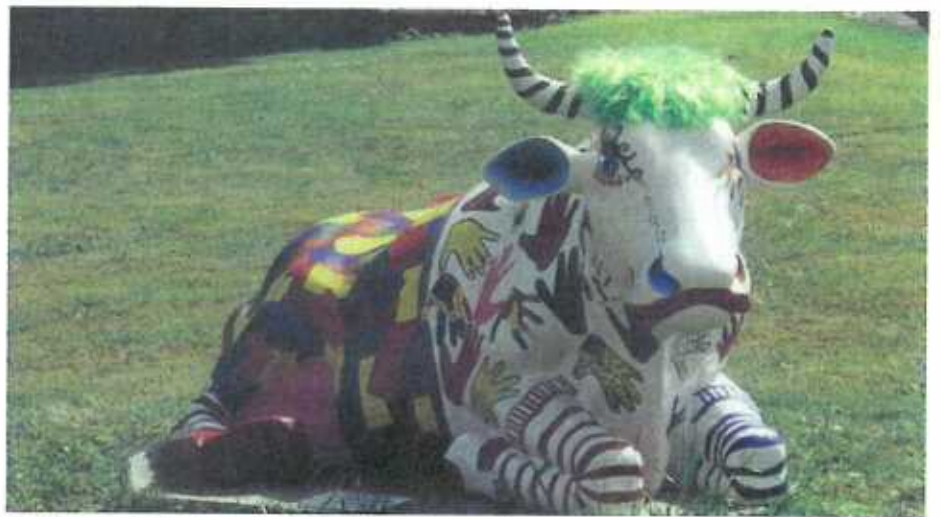
Gekloonte Kouh: fortgelaaf aus dem Zirkusstall.

Wéi geet et weider mat eisem berühmten Thema iwwert den öffentliche Transport? Amplazt eppes wëllen ze bauen wéi de Projet Bus-Tram-Bunn, waat Milliarden kascht, géif ech virschloen, méi Parc & Ride'en ze bauen, an d'Leit forcéieren, déi och ze benotzen.