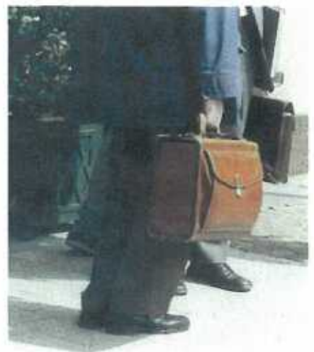
Was war noch mal mit der "Affäre von der Valise"?