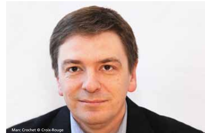
Marc Crochet © Croix-Rouge

Christian Theis: Neen esou Beräicher ginn et net. Grondsätzlech kënnen all d'Aarbechten och vun Benevollen oder Volontäre gemaach ginn. Déi eenzeg Viraussetzung ass, datt se déi néideg Kompetenze matbréngen, well et ginn natier-