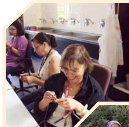
Participation de la Stëmm à „Urban knitting“ à Esch sur Alzette Des arbres et poteaux du quartier de la gare à Esch ont été ornés de papillons, de manteaux de laine, de couvertures... Objectif: mettre en valeur le paysage urbain. Depuis le mois de juin, une douzaine de personnes de la Stëmm (ATI Schweesdrëps) ont réalisé des écharpes et autres décorations. Certaines étaient de vraies tricoteuses et d'autres ont appris. Après la création en petit groupe une fois par semaine, certaines sont allées installer les travaux réalisés et d'autres ont participé au vernissage. Toutes ont très envies de s'investir à nouveau dans ce type de projet.