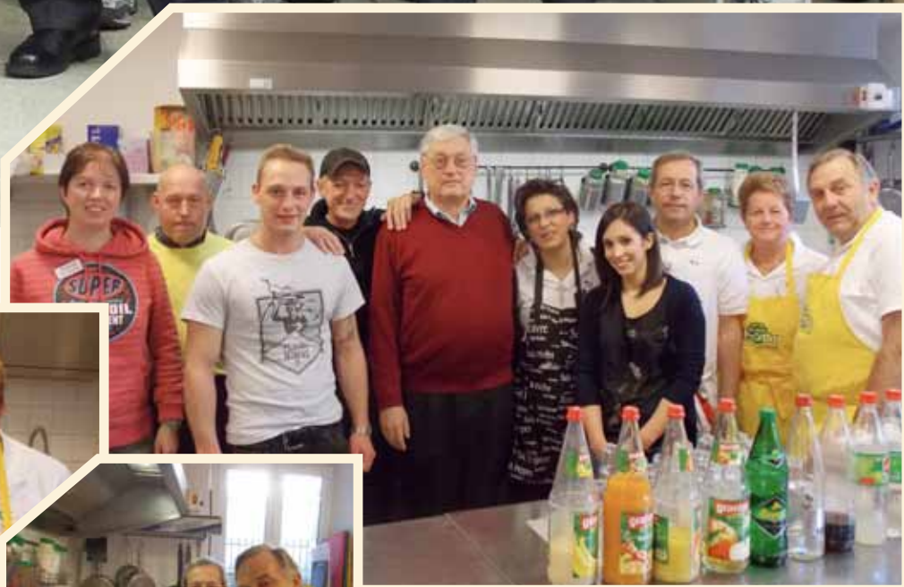
D'Amitié Italo-Luxembourgeoise Bettembourg/Dudelange kacht fir d'Stëmm vun der Strooss Fir d'véierte Kéier koum eng Equipe vun der Amitié Italo-Luxembourgeoise Bettembourg/Dudelange op Esch an d'Stëmm kachen! Um Menu stoungen dës Kéier: Penne Napoli mat Bouletten an als Dessert e Stéck Quetschentaart! D'Nuddele goufe gesponsert vu Maxim. Hinnen alleguer villmools Merci!