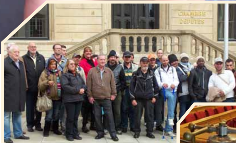
Visite vun der Chambre des Députés Bei der Visite guidée vun der Chambre des Députés goufe mir vun enger frëndlecher Madamm empfaangen, déi sech Zäit fir eis geholl huet an eis alles op Lëtzebueresch a Franséisch erkläert huet. Mir sinn an de Sall gaangen, an ech hu mech direkt op de Stull niewent der Plaz vum Här Mosar gesat, well vun där Geleeënheet muss ee profitéieren. Mir konnten dann all e puer Froe stellen, mä leider hat de Chamberpresident net ganz vill Zäit fir eis. No enger Gruppfoto an e puer frëndleche Wieder huet hien eis fir d'Zukunft alles Guddes gewënscht.