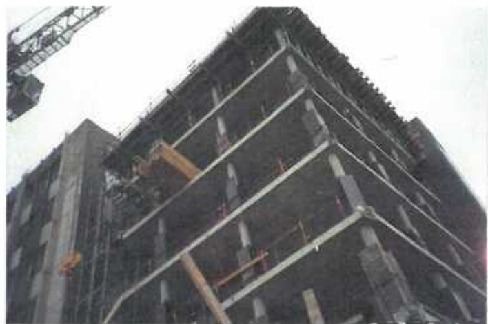
L'amour est un chantier permanent - qui au mieux n'est jamais achevé.

Je parle d'un cas que je connais plutôt bien: le mien. Après avoir, pour la n-ième fois, fui le cercle de la drogue grâce à un substituant (méthadone), j'ai profité de cette nouvelle liberté (procurée par l'abstinence de la drogue)