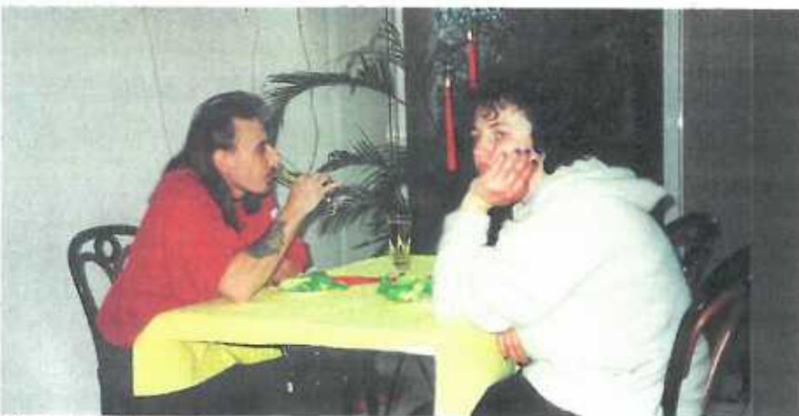
Wo keine Worte mehr sind, ist auch die Liebe verschwunden. Sprachlosigkeit ist ein Alarmsignal.