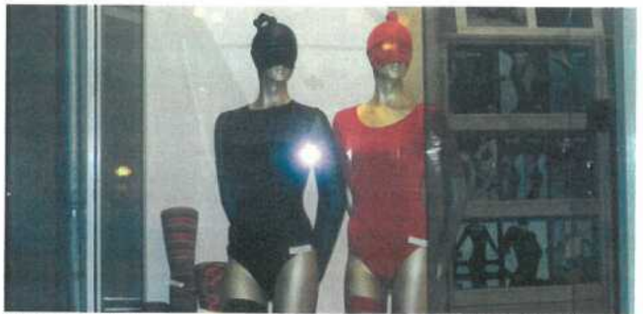
Liebe macht blind.

Ass déi Léift aawer elo zerstéiert an et geet een auserneen, dann geet et rapid mat der Moral den Bierg erof. Krank wéi een Hond, net méi schloofen, net méi iessen. De Bauch esou eidel, wou fréier d'Fliegeren geflun sin. Meeschtens vernooléisst een seng Aarbecht a seng Frënn, sou wäit déi een net schons vum selwen faale gelooss hun, well déi meescht sech souwisou vun deenen Problemer eraus wellen haalen an et se net interesséiert.