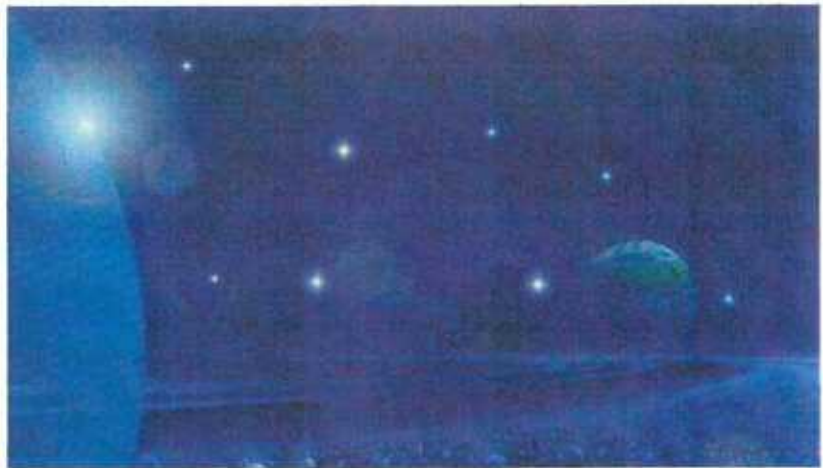
D'Männer sin wei Stären, owes kommen si an muerges sin si fort.