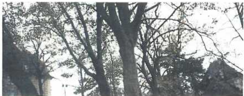
Wéi ee Baam kann och d'Léift net ouni eng gesond Wuerzel bis zum Gipfel wuesses.