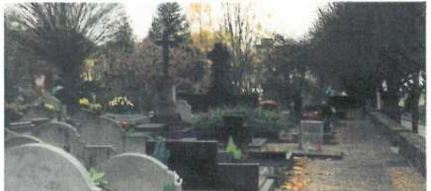
D'Léift, déi richtig, déif Léift geet iwert den Doud eraus.

Ech sin nach net ganz doriwer ewech, waat jo normal ass, mee ech hoffen dass ech gläich eng aaner Partnerin fannen, waat ech grad esou gären