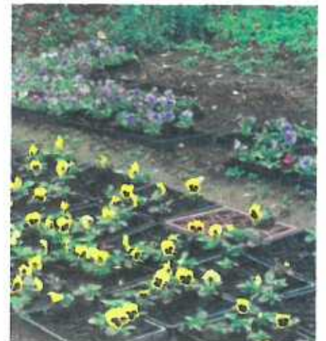
Vergissmeinnicht? Blumen können mehr sagen als Worte!