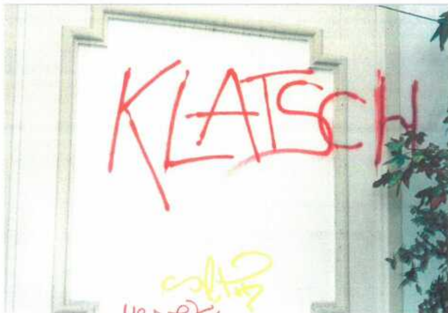
Le son du coeur à l'atterrissage, quand le nuage rose s'est dissipé.