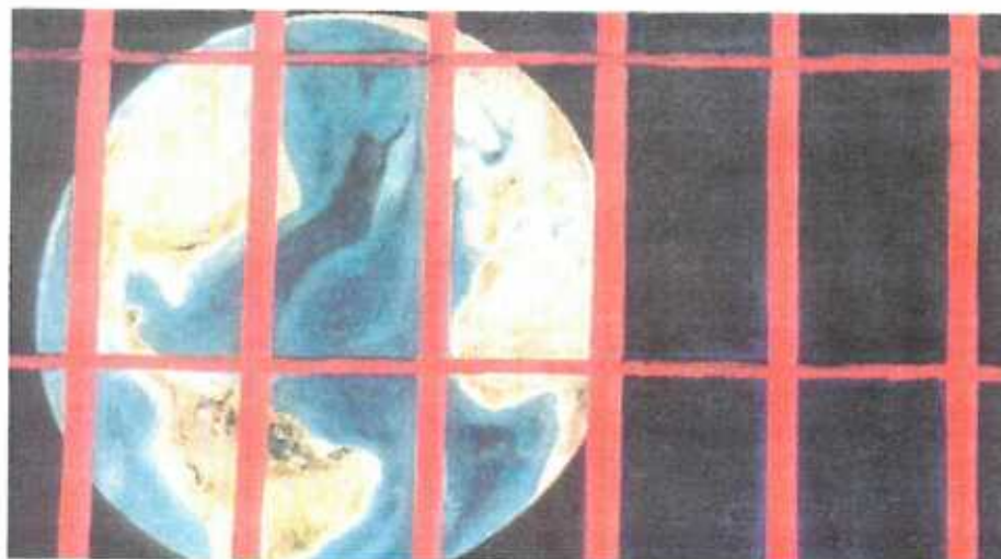
"La terre tourne" - Auch hinter Gittern dreht die Welt sich immer noch.