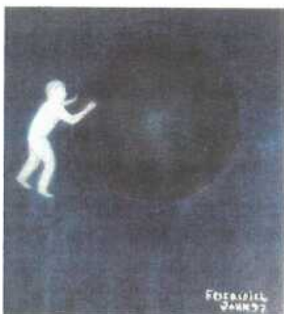
Boule de chagrin - Es ist ein schwieriger Weg, sein Leben wieder ins Rollen zu bringen.

Als die Verantwortlichen merkten, dass er es mit der Kunst sehr ernst meinte bekam er grünes Licht. Seine Kunst wurde respektiert und unterstützt von der Generalstaatsanwaltschaft sowie von der Direktion. Zu dieser Zeit wurden schon einige Bilder von ihm verkauft und im offenem Strafvollzug beteiligte er sich an Ausstellungen, wie zum Beispiel "Art in Beaufort" wo er auch letztes Jahr ausgestellt hat. In