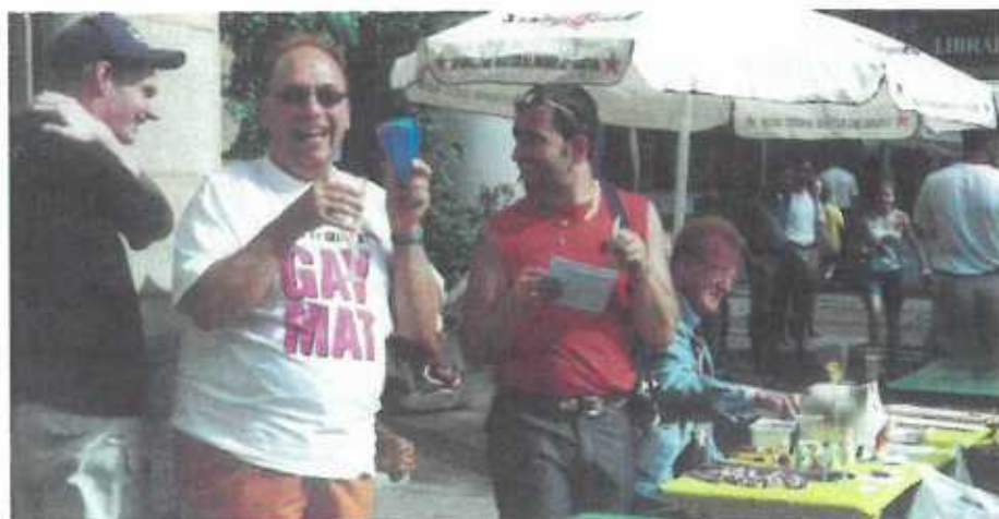
"Gay" oder "Lesbesch". Kultur hun si trotzdem an si sin stolz drop.

XX: Déi Art vun Liewensform soll ganz einfach Staatlech an gesellschaftlech unerkannt gin.