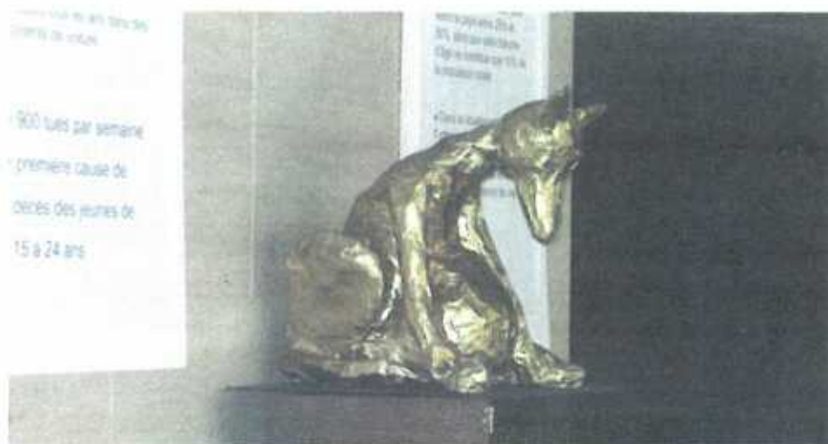
Wann de Misch wéisst, datt ech vum Kueb erwaarden.