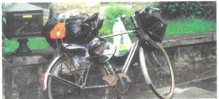
So! Hiermit brauche ich bestimmt keinen Fahrschein mehr vorzuzeigen.

Dann fuhren wir weiter, froh gelaunt, mit dem Stadtexpress nach Mannheim, wo wir dann den nächsten Zug nach Heidelberg nahmen, weil in Mannheim der Bahnhof geschlossen war und es heftig regnete. In Heidelberg dagegen konnten wir im Bahnhof übernachten und gingen morgens um 7 Uhr in die Bahnhofsmision zum Kaffee trinken, weil wir kein Geld mehr hatten. Ausser dem war unsere gute Laune weg, weil wir auch die Bahn nicht mehr bezahlen konnten.