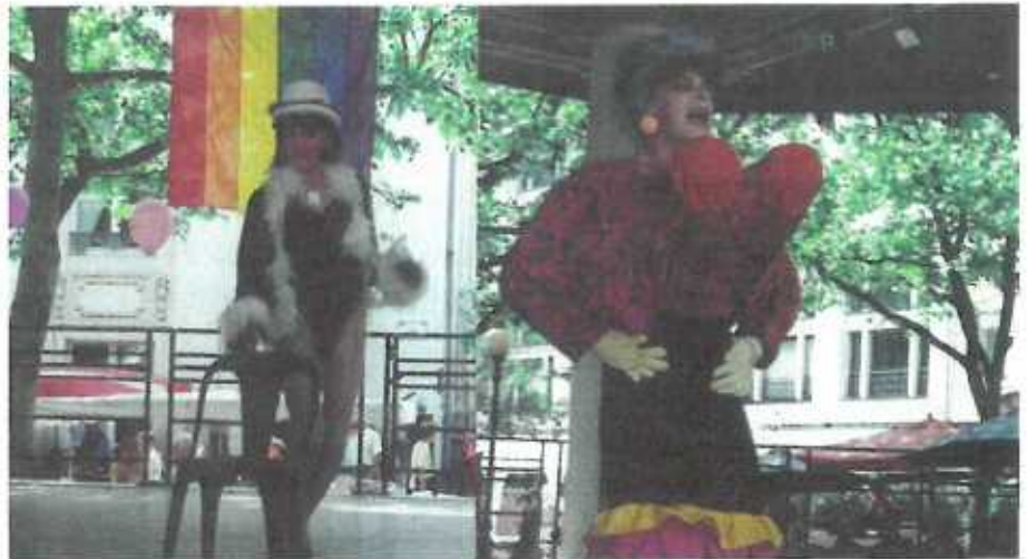
"Les Divas de la Nuit" am vollem Asaatz.