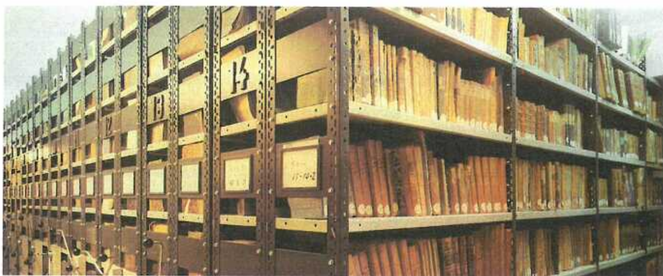
D'Nationalbibliothék, Kulturhaus "par excellence"!

Well mir des Kéier iwwert d'Thema "Kultur" schreiwen, war ech mech e bësschen an eis Nationalbibliothék informéieren, well ech fonnt hun, datt Liesen nach ewell ganz vill mat Kultur ze din huet.